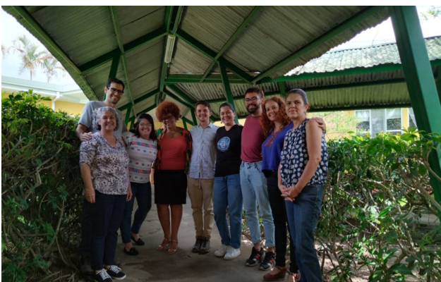
Parte del equipo DEI 2022

Así mismo, este instrumento nos facilita el monitoreo de los avances, para tomar las medidas necesarias a tiempo, que nos permitan cumplir nuestras metas, objetivos y actividades.