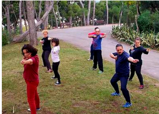
Imagen con fines ilustrativos

El Chikung es parte de la milenaria Medicina Tradicional China.