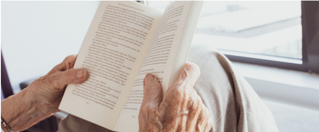
Imagen con fines ilustrativos

Actualmente el DEI abre sus puertas a un grupo de construcción literaria, dirigido a personas adultas mayores. Quienes se reúnen dos lunes al mes con el fin de brindar herramientas a esta población para construir y contar sus historias. Si desea más información, se puede comunicar con Evelyn Silva al 8876-6653.